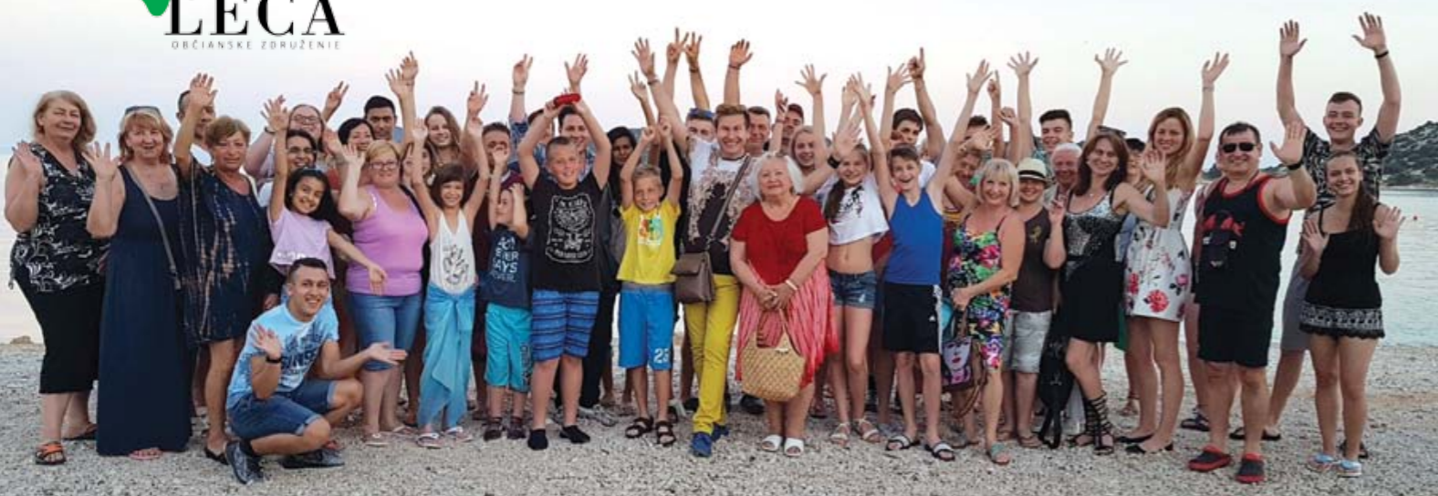
Skupina účastníkov workshopu o.z. LECA v Chorvátsku