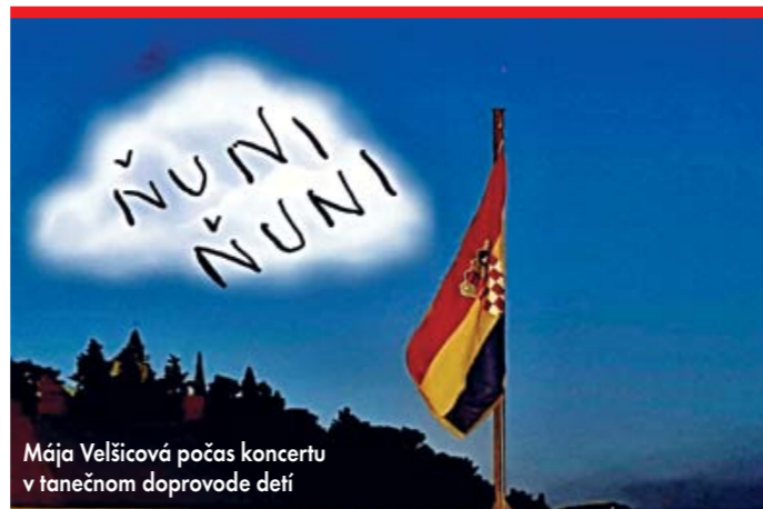
Mája Velšicová počas koncertu v tanečnom doprovode detí