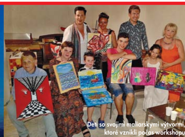
Deti so svojimi maliarskymi výtvarmi, ktoré vznikli počas workshopu