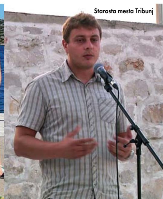
Starosta mesta Tribunj