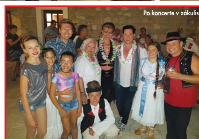
Po koncerte v zákulisí