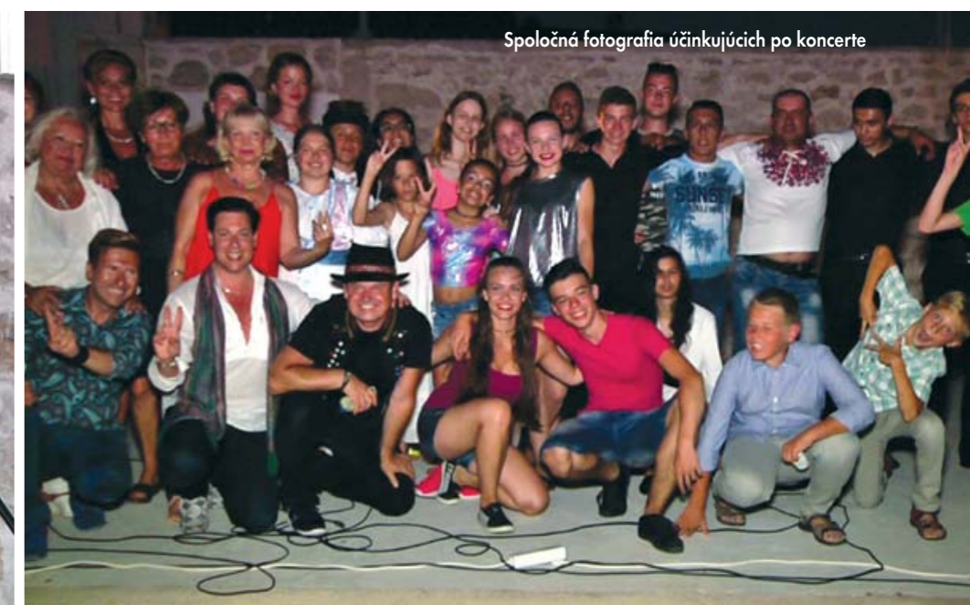
Spoločná fotografia účinkujúcich po koncerte