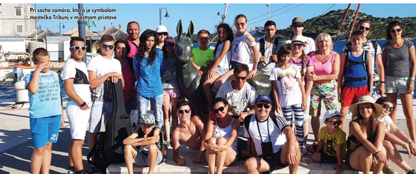
Pri soche somára, ktorá je symbolom mestečka Tribunj v miestnom prístave