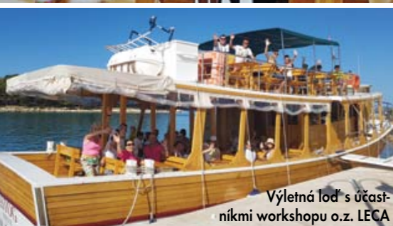
Výletná loď s účastníkmi workshopu o.z. LECA