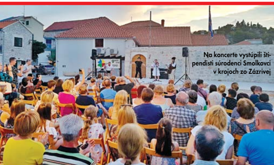
Na koncerte vystúpili štipendisti súrodenci Smolkovci v krojoch zo Zázrivej