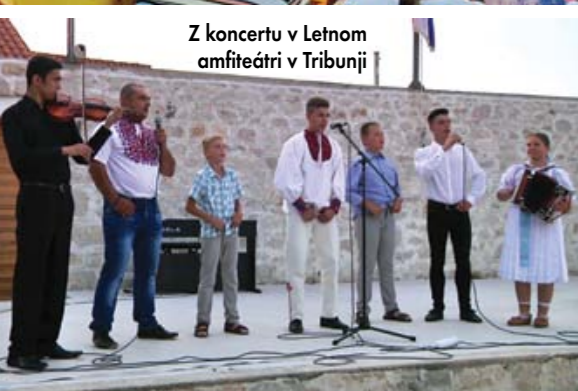
Z koncertu v Letnom amfiteátri v Tribunji