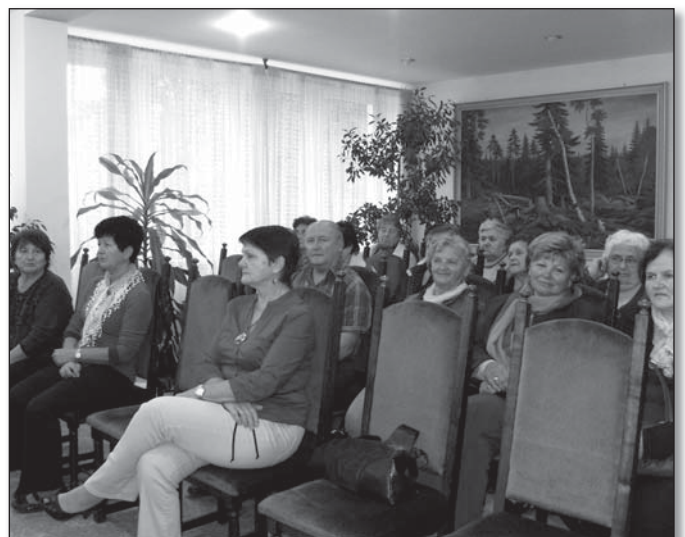
● Časť účastníkov prednášky k Svetovému dňu srdca