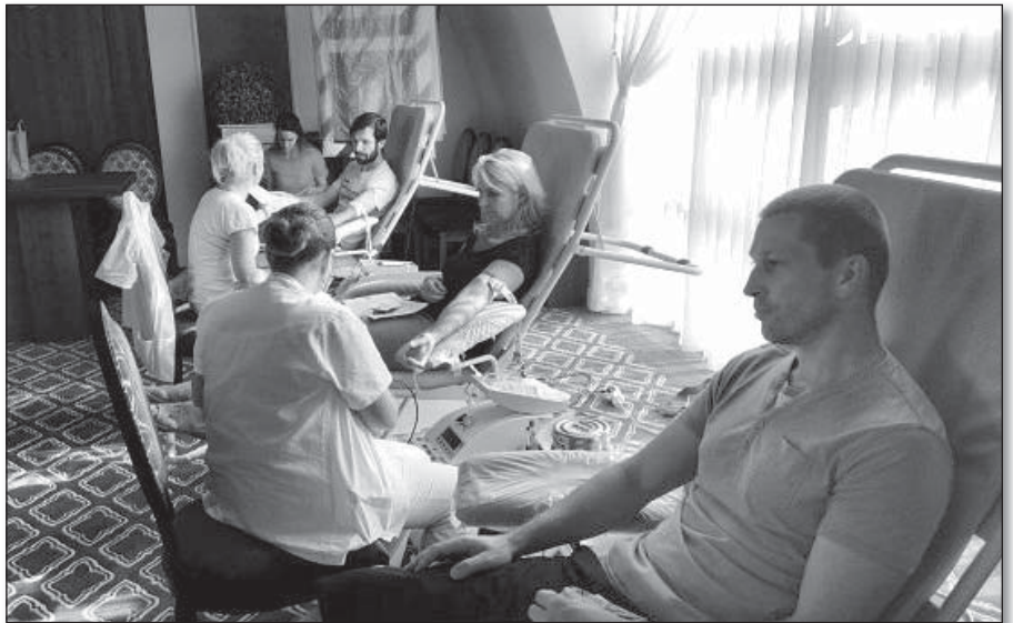
● V pohodlí obecného úradu darovalo v auguste krv 32 bezpríspevkových prvodarčov

V dňoch 28. a 29. novembra MS SČK po prvýkrát zorganizoval výstavu betlehemov a anjelov. Uskutočnila sa v zasadačke miestnosti obecného úradu za účasti 28 vy-