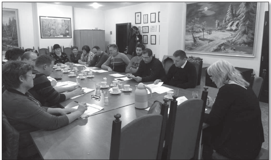
● Zasadnutie komisií OZ Madunice (Komisia pre vzdelávanie a kultúru, Komisia sociálna, zdravotná, bytová a Komisia mládeže a športu) k prerokovaniu návrhu rozpočtu obce

verejného osvetlenia v obci Madunice a výsledkoch o spôsobe a postupe plnenia určitých podmienok a splnomocnilo starostku obce k podpisu Zmluvy o poskytnutí nenávratného finančného príspevku s MH SR, - zmenu rozpočtu Obce Madunice Rozpočtovým opatrením č. 9/2015 – RO starostky obce zo dňa 30.9.2015, a to presunom rozpočtových výdavkov v rámci schváleného rozpočtu, pričom sa nemenia celkové príjmy a celkové výdavky. Rozpočet po RO č. 9/2015 bude vo výške 1 380 071,00 €,