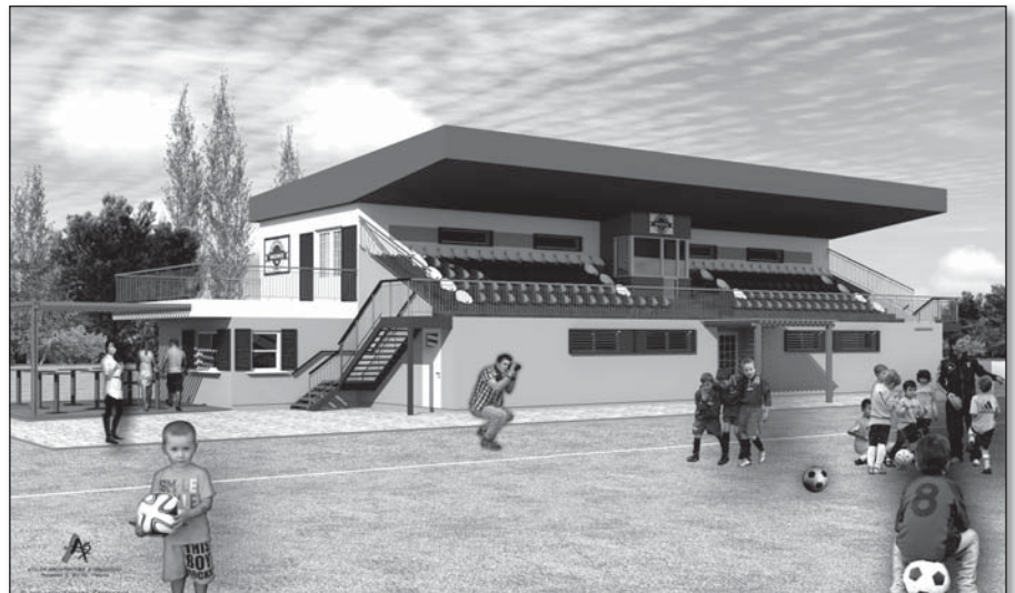
• Takto by mala vyzerat' zrekonštruovaná tribúna Telovýchovnej jednoty Madunice

Požiadali sme o stavebné povolenie na rekonštrukciu a nadstavbu tribúny na štadióne, z dôvodu absolútne nevyhovujúcich podmienok súčasného stavu. Máme vypracovaný veľmi pekný projekt, ale rozpočet na akciu vo výške 504 000,- € vrátane DPH je príliš veľkým kúskom pre obec. Niečo sa určite ušetrí na verejnom obstarávaní, aj napriek tomu to však bude veľká suma. Po-môcť by mohol jedine úver, lebo na takéto