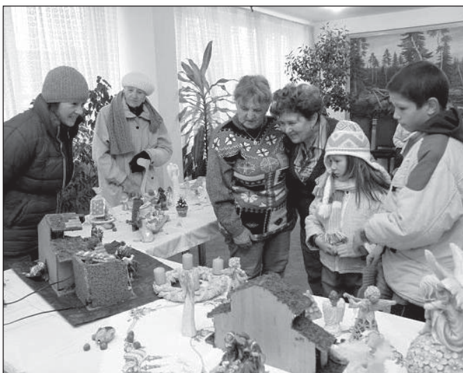
● Prvá výstavu betlehemov a anjelov v Maduniciach si prezrelo 150 návštevníkov