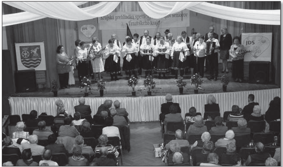
● Vystúpenie súboru Bojničan z Bojničiek

Na prehliadke sa predstavilo dovedna osem zborov – Rošindolčané z Ružindola, Nezábudka a veselí chlapi z Veľkého Medera, Rozmarínky z Piešťan, Petrané z Plaveckého Petra, Pustakerčanka z Pustých Sadov, Valša z Holíča, Bojničan z Bojničiek a domáce Seniorky. Presnejšie, chór speváčok, ktoré síce