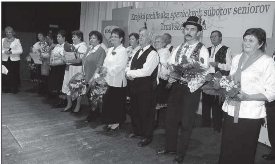
● Záverečné pod'akovanie a kvety vedúcim zúčastnených súborov